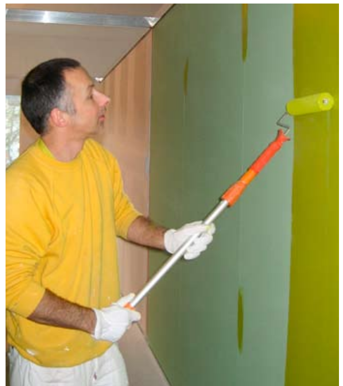
Schweizerischer Maler- und Gipserunternehmer-Verband SMGV